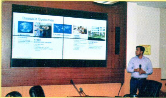
मीटिंग में प्रस्तुतिकरण करते हुये अधिकारी।