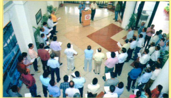
शपथ लेते अधिकारी एवं कर्मचारीगण।