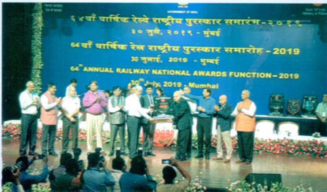
64वें वार्षिक रेल वार्षिक पुरस्कार समारोह 2019 में पुरस्कार लेते हुये महाप्रबन्धक महोदय आरेडिका

दिसंबर 2018 में, MXF का Coach Production Target 1250 Coach से 1425 Coach कर दिया गया। जिसमें भंडार विभाग त्वरित कारवाई करते हुये समय से सामग्री की उपलब्धता सुनिश्चित की जिससे MXF अपना उत्पादन लक्ष्य प्राप्त कर सका।