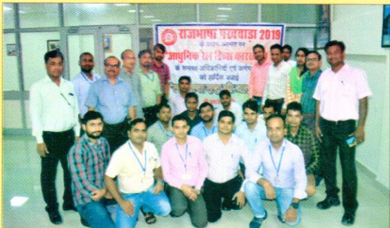
राजभाषा पखवाड़ा 2019 में उपस्थित कर्मचारीगण एवं राजभाषा अधिकारीगण