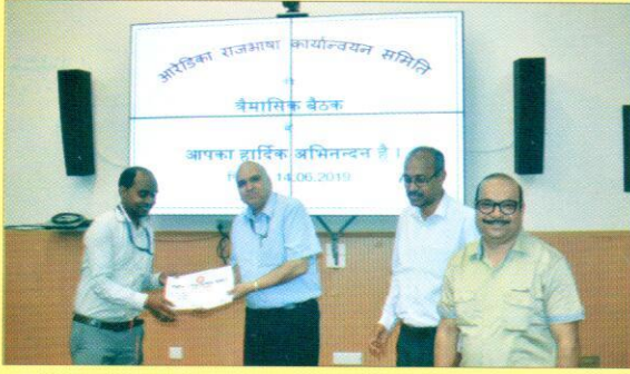
कर्मचारियों को प्रमाण पत्र देते महाप्रबन्धक महोदय।