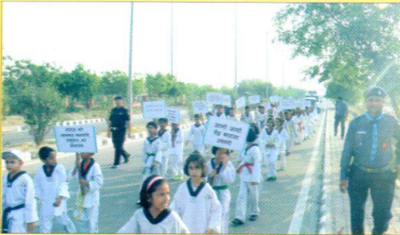
विश्व पर्यावरण दिवस में प्रभात रैली निकालते बच्चे।