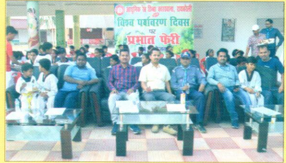
विश्व पर्यावरण दिवस पर आये अधिकारी एवं कर्मचारीगण।