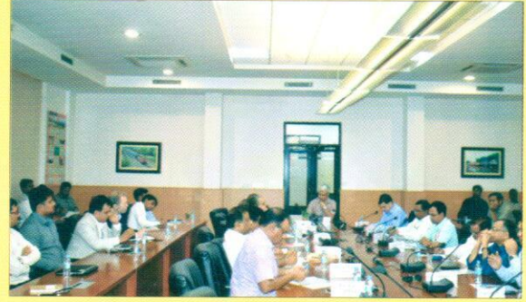
मीटिंग करते कर्मचारी एवं अधिकारीगण।