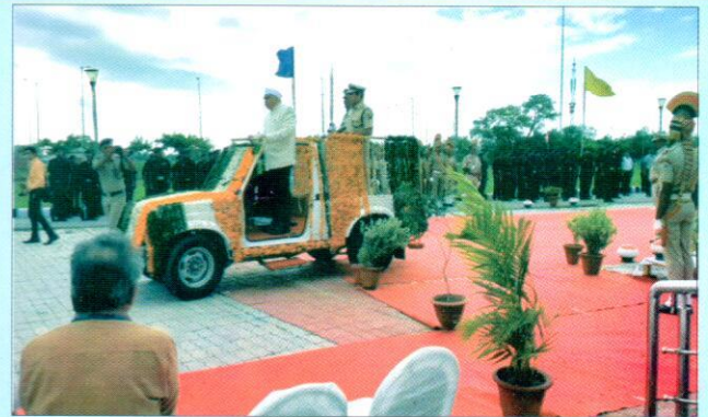
स्वतंत्रता दिवस के अवसर पर महाप्रबन्धक महोदय आरेडिका