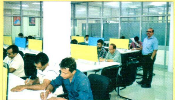
निबन्ध प्रतियोगिता में भाग लेते कर्मचारीगण।