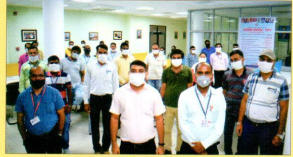
राजभाषा पखवाड़ा 2020 में दिनांक 3.9.2020 को उपस्थित अधिकारीगण एवं प्रतियोगीगण।