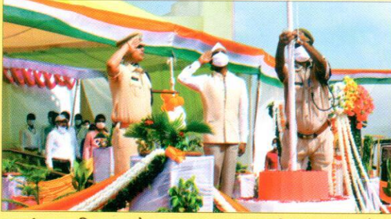
स्वतंत्रता दिवस के अवसर पर राष्ट्रीय ध्वज को सलामी देते महाप्रबन्धक महोदय।