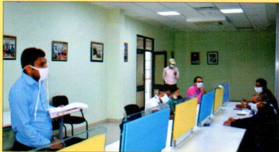
आचार्य महावीर प्रसाद द्विवेदी पुस्तकालय में प्रश्नोत्तरी (क्विस) प्रतियोगिता में भाग लेते प्रतियोगीगण।