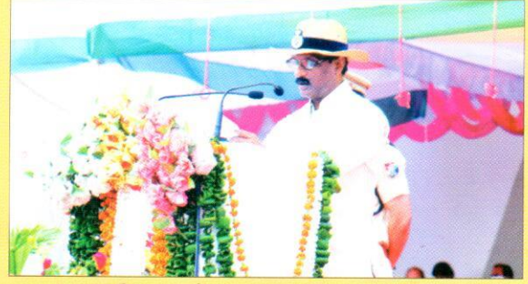
स्वतंत्रता दिवस के अवसर पर सम्बोधित करते महाप्रबन्धक महोदय।