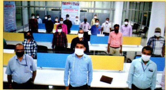
दिनांक 7.9.2020 को प्रश्नोत्तरी (क्विस) प्रतियोगिता में उपस्थित अधिकारीगण एवं प्रतियोगीगण।