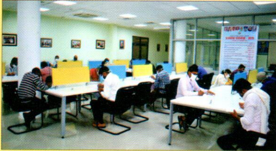
दिनांक 5.9.2020 को निबन्ध प्रतियोगिता में भाग लेते प्रतियोगीगण।