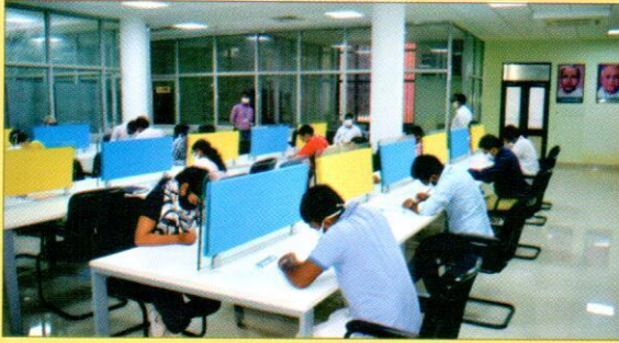
दिनांक 3.9.2020 को शब्द अनुवाद प्रतियोगिता में भाग लेते प्रतियोगीगण।